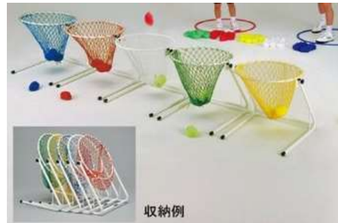
A76 低床型玉入れ A77 カー玉