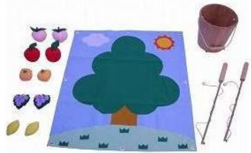
A72 くだもの収穫つりゲーム