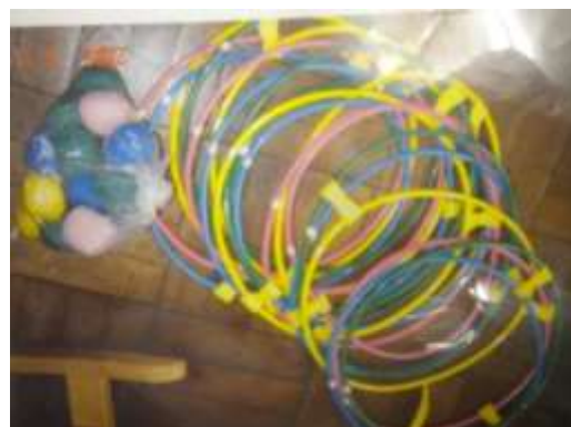
A24 カラーお手玉 (サークルトレーナー)