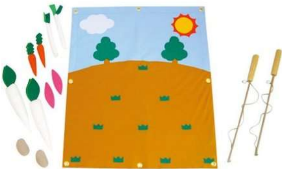
A73 やさい収穫つりゲーム