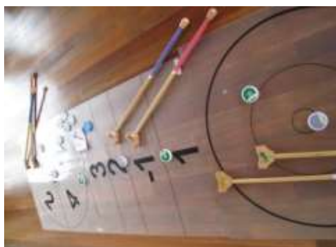
A36 ペタボード基本セット