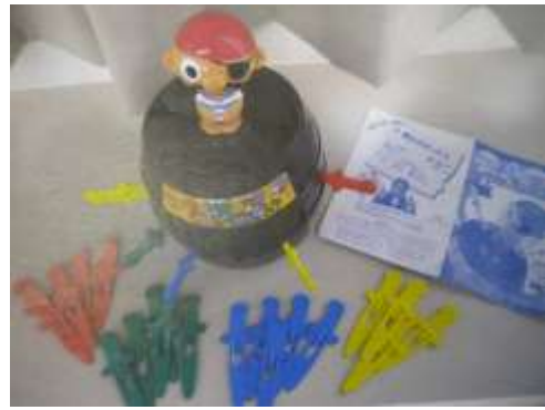
A39 ジャンボ黒ひげ危機一髪