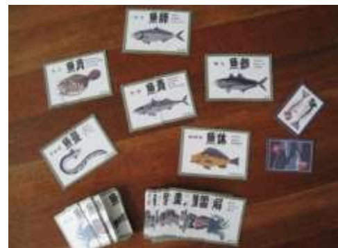
A37 魚魚あわせ 江戸前版