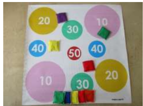
A88 ターゲットプレイシート