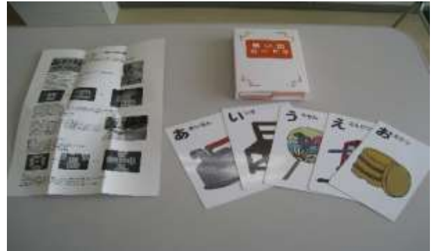
A65 思い出かた昭和の名曲 A66 思い出カード 昔の日用雑貨