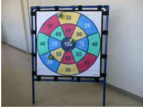
A89 ターゲットゲーム