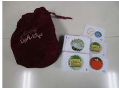
A74 スキャジャンケンゲーム