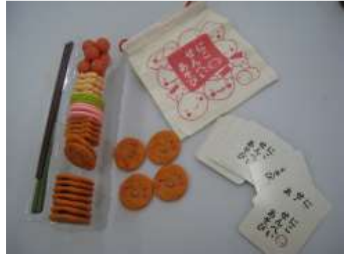
A82 にこせんべい遊び