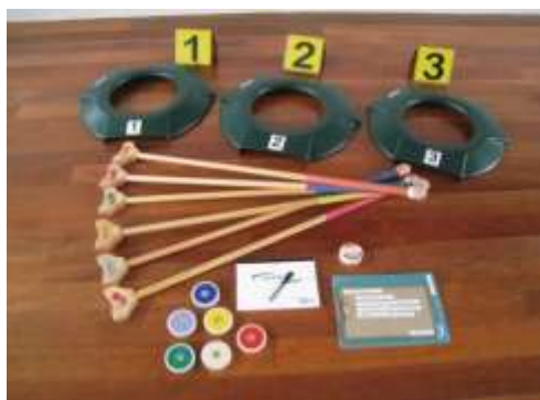
A18 ペタゴルフセット