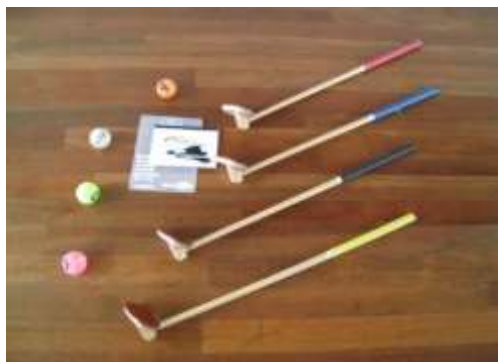
A17 レクスポ°ゴルフセット