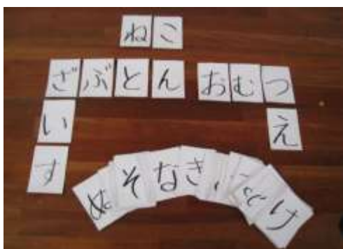
A28 言葉合わせゲーム