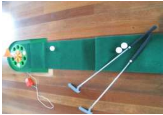
A38 ニュールレットゴルフ