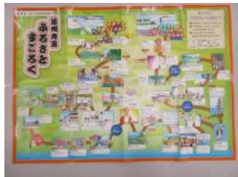
A86 遠州方言ふるさとすごろく