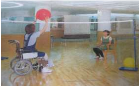
A71 風船バレーセット