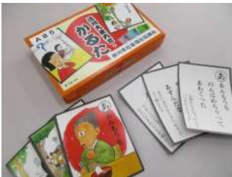
A85 遠州大東方言かるた