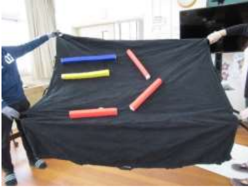
A97 チームラビリンス