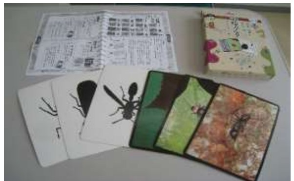
A67 どうぶつあわせ A68 影絵カルタ