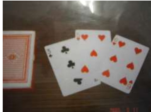
A5 ジャンボトランプ