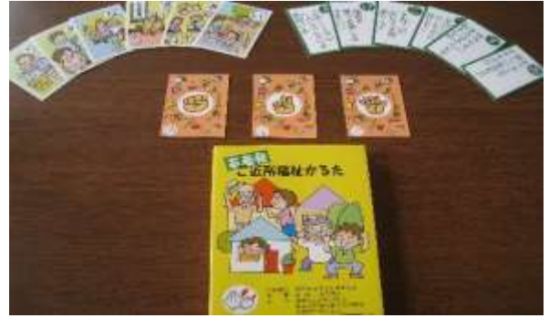
A63 木版画なつかしの歌かた A64 若者発ご近所福祉かた