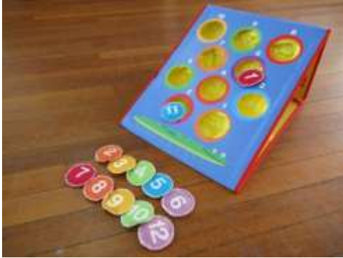
A99 ボードお手玉入れ