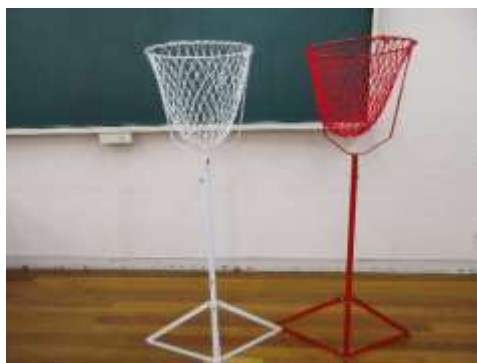
A58 紅白玉入れ台 (台のみ)