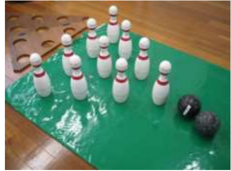
A3 ボウリングゲーム