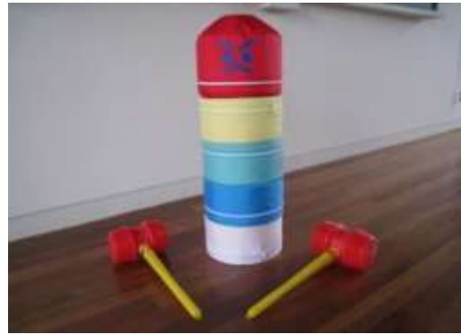
A31 だるまおとしゲーム