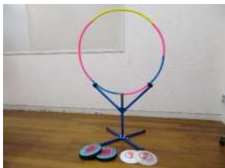
A15 フライングディスク