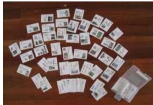
A29 掛川城下町 36 景カルタ