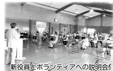
新役員とボランティアへの説明会

地区福祉協議会が刷新され「さあこれから」という時にコロナウイルスにより活動が停止してしまいましたが、緊急事態宣言中の期間は除き、子育て支援事業の「おや子ふれあいの部屋」は感染予防対策を講じた上で実施することができました。親子で七夕の短冊に願い事を書いて竹に飾り付け、七夕祭りを楽しみました。