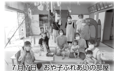
7月7日 おや子ふれあいの部屋