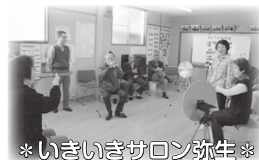
※いきいきサロン弥生※