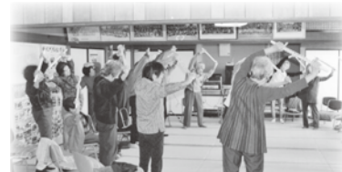
※城北町いきいきサロン※

昨年度は5区全体で延べ1,500名以上の参加者がありましたが、今後も高齢者の皆さんが元気にいきいきと参加できる催し物を提供できるように活動したいと思います。