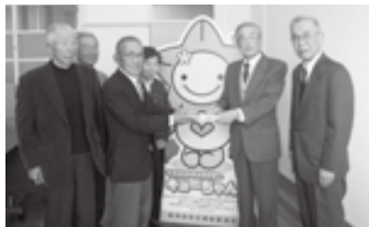
▲シニアクラブ掛川支部