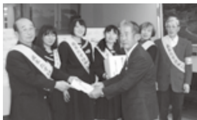
▲大東明るい社会づくり運動推進協議会の会員の方々と協力してくれた学生のみなさん