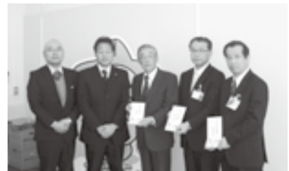
▲連合静岡東遠地域協議会のみなさん