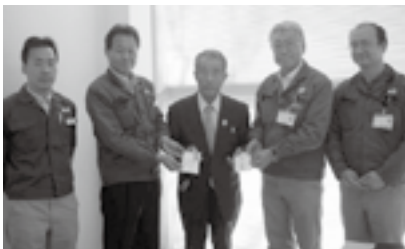
▲矢崎部品株式会社矢崎部品労働組合（大浜工場・大東工場）のみなさん