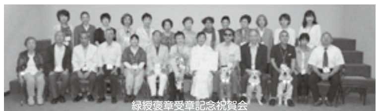
緑綬褒章受章記念祝賀会

ボランティアに関する相談・問合せは ボランティアセンター・南部大東ふくしあ社協・南部大須賀ふくしあ社協まで