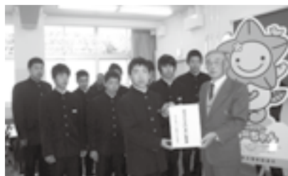
▲明るい社会づくり運動静岡県掛川地区協議会の方と協力してくれた学生のみなさん