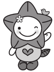
掛川社協キャラクター キョーちゃん