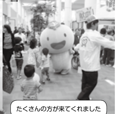
たくさんの方が来てくれました