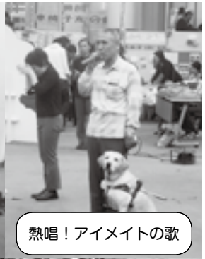
熱唱！アイメイトの歌