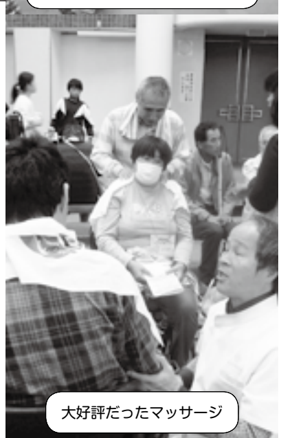
大好評だったマッサージ