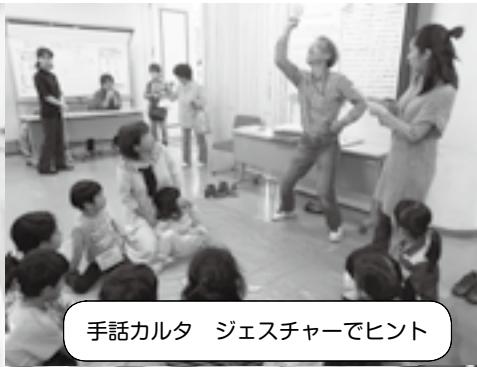
手話カルタ ジェスチャーでヒント