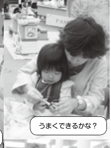
うまくできるかな？