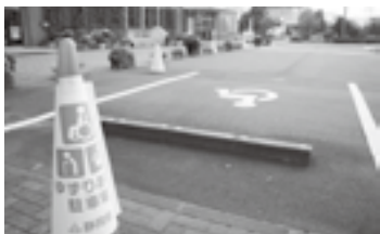
市役所大須賀支所駐車場

右図のようなステッカーまたは、路面表示がされている駐車場と、従来の車いすマークの駐車場です。