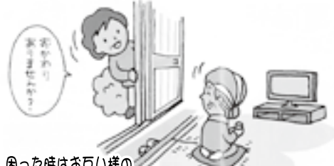
困った時はお互い様の あたたかい支えの輪が広がっています。