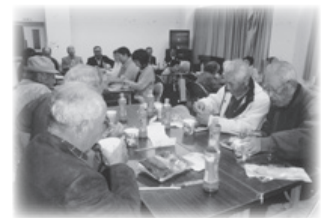
★ふれあい交流会の様子★

今年度は新型コロナウイルス感染症拡大防止のため、ふれあい交流会や勉強会は中止となりましたが、現代の高齢化社会において必要な事業だと感じます。ふれあい交流会では、ゲームをおこなったり、歌をうたったりし、お弁当を食べながら昔話をしてみたりと楽しい時間を過ごしてもらいたいと思っています。友愛訪問は、民生委員と連絡を取りながら、年齢に関係なく、一人暮らしや外出が困難な方を訪問し、つながっていきたくらいと思っています。