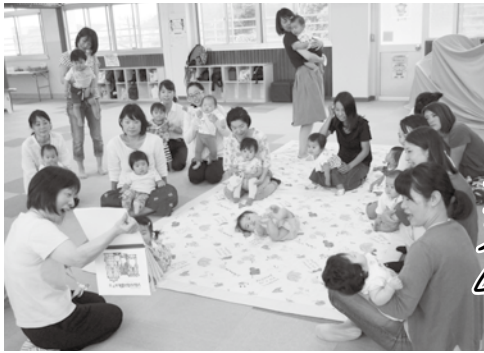
親子で絵本タイム。