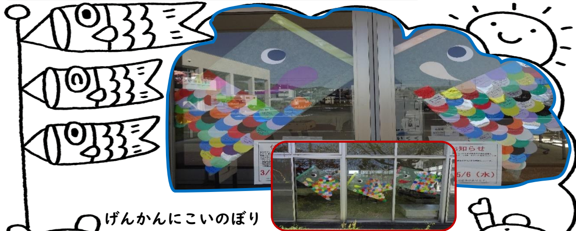
げんかんにこいのぼり

といあわせ☆もうしこみ 開館時間 9:00~17:00 ☎ 48-5965 開館日 月~土(日・祝・年末年始休館) おおすかじどうかん