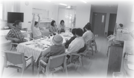
大東なかよし店より

市内では掛川市立中央図書館（城下店）と大東苑（大東なかよし店）で毎月実施しています。