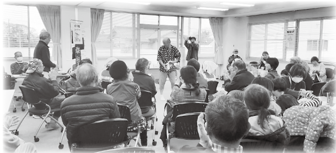
次は原谷地区の紹介です。お楽しみに♪

支部毎の活動の他、会全体の活動として大須賀市民交流センターを会場に「福祉ふれあいまつり」を年1回開催しています。