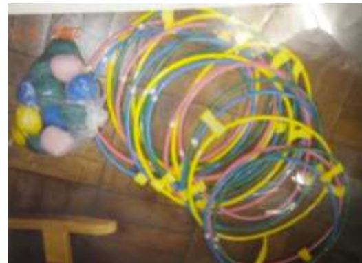
A24 カラーお手玉 (サークルトレーナー)