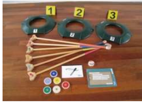
A18 ペタゴルフセット