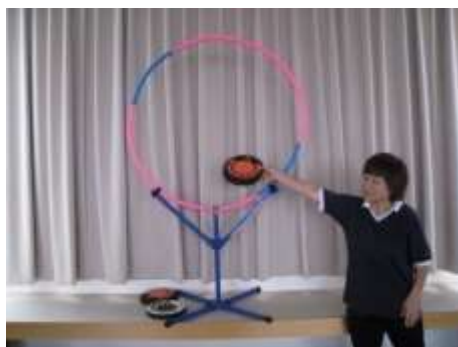
A15 フライイングディスク