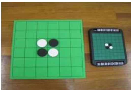
A50 オセロ (大)