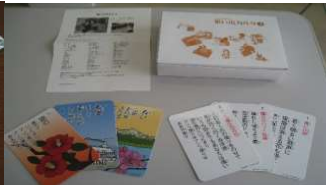
A65 思い出かた昭和の名曲