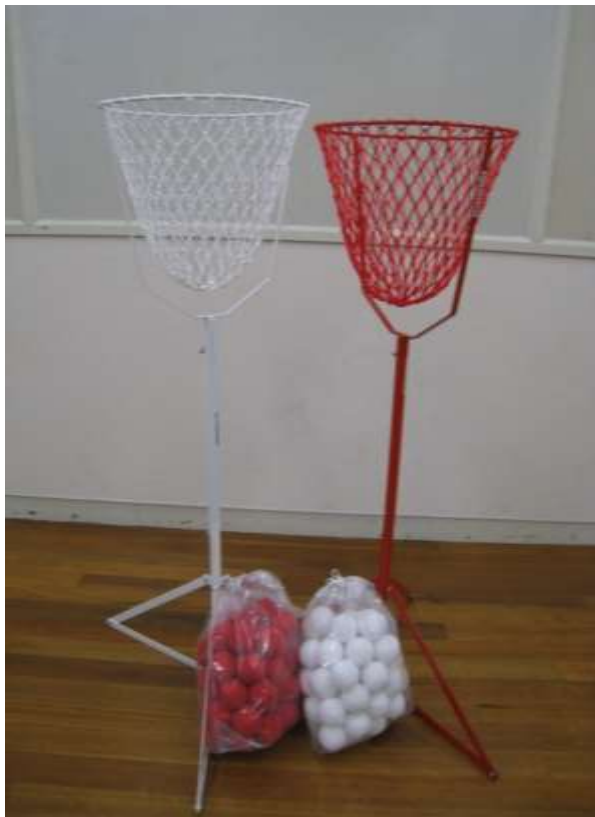
A58 紅白玉入れ台 (台のみ)