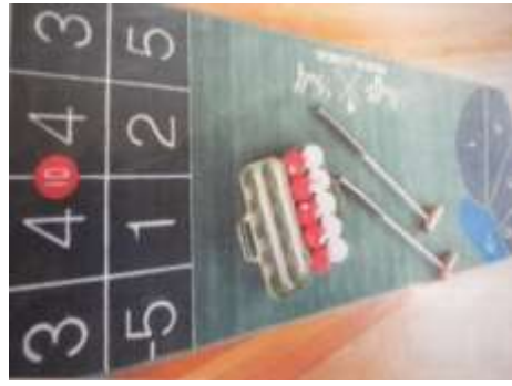
A2 シャッフルゴルフ