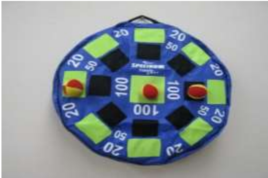
A55 やさしいダーツゲーム