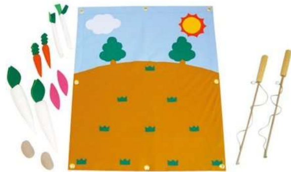
A72 くだもの収穫つりゲーム A73 やさい収穫つりゲーム