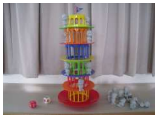
A34 ジャンボぐらぐらゲーム