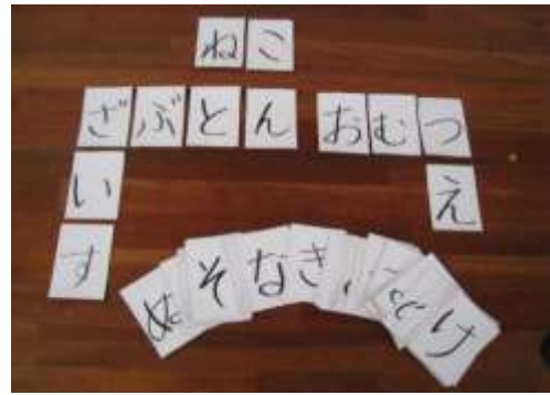
A28 言葉合わせゲーム