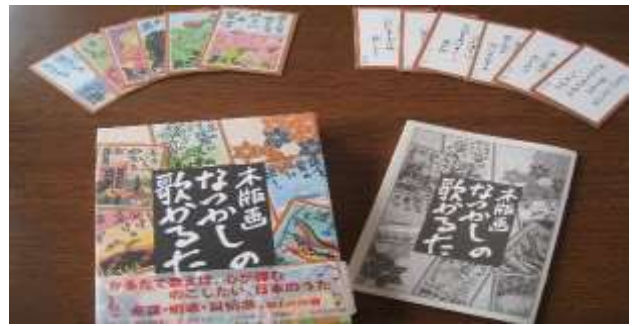
A63 木版画なつかしの歌かた