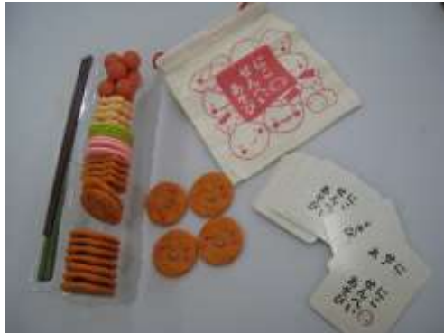
A82 にこせんべい遊び