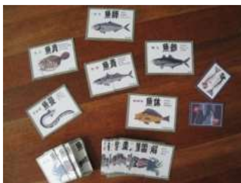
A37 魚魚あわせ 江戸前版