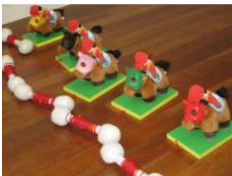
A7 糸巻きダービーゲーム