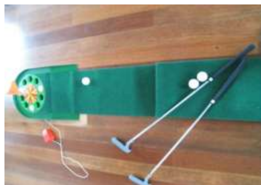
A38 ニール-レットゴルフ