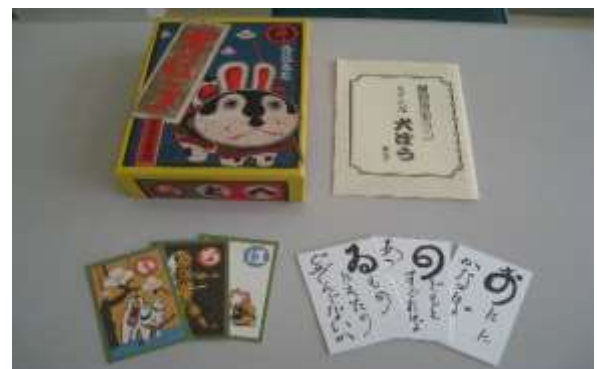
A69 武井武雄犬ぼうカルタ