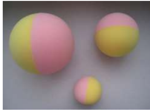
A30 鈴入りスポンジボール