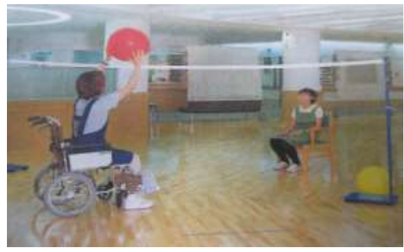
A70 しりとリブロックくずし A71 風船バレーセット