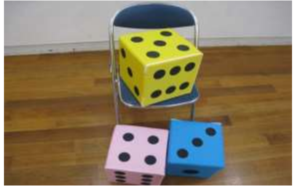
A54 ソフト大型サイコロ