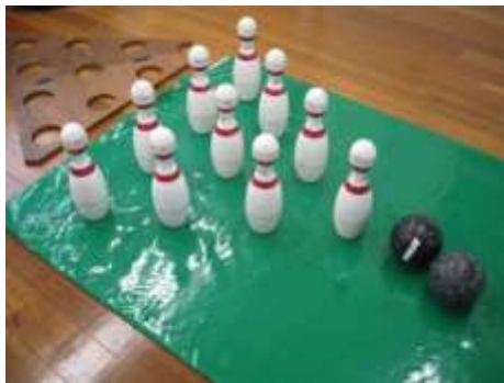
A3 ボウリングゲーム