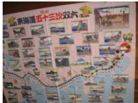
A4 ジャンボすごろく