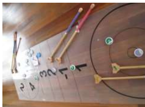
A36 ペタボード基本セット