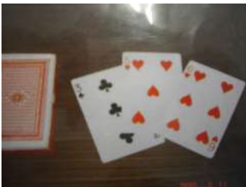
A5 ジャンボトランプ