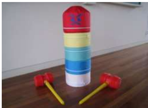
A31 だるまおとしゲーム