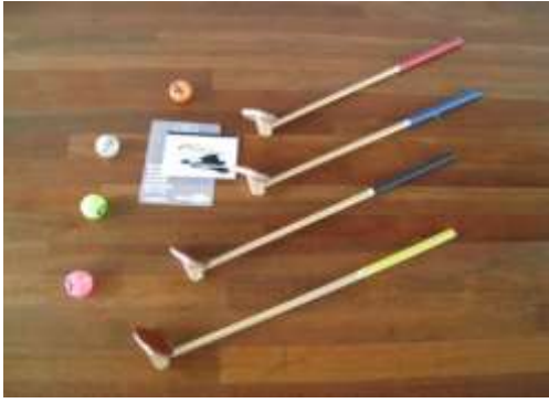
A17 レクスポ°ゴルフセット