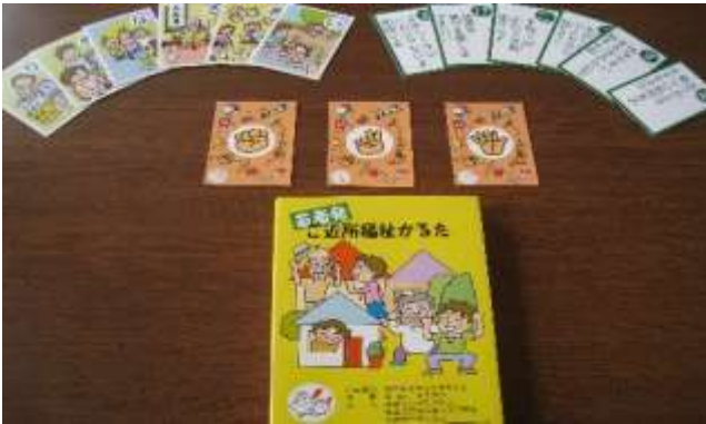
A64 若者発ご近所福祉かた