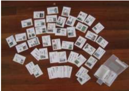
A29 掛川城下町 36 景かた