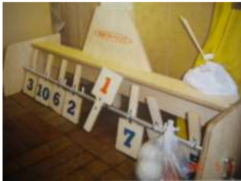
A11 的あてボウリング