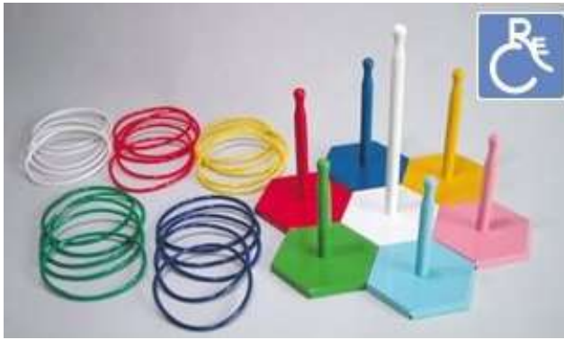
A79 フリースタイル輪投げ