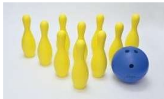
A76・77 低床型玉入れ、カー玉 A78 ソフトフォームボウリングセット