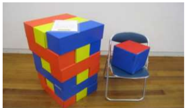
A59 大型バランスゲーム