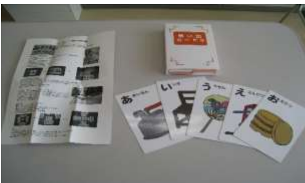
A66 思い出かた昔の日用雑貨