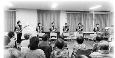
*高齢者昼食懇談会*

西郷地区福祉協議会は、会長、副会長等役員の外に、西郷10区から選任された20名の地区役員と民生委員、活動支援ボランティアの皆さんで構成され、年間の活動計画に沿って活発に運営しています。主な活動は、高齢者の皆さんに対して毎月「高齢者サロン」を開催し、軽い運動や、懐かしい童謡の合唱、茶話会等を行っています。また、子育て中のお母さんたちを対象に子育てサロン「子育て広場らんこ」も毎月実施しています。特に毎年、秋に開催する「高齢者昼食懇談会」では社協役員全員が参加し、楽しい演芸やゲーム大会等を通して、スタッフとの交流も行っています。これからも支援活動や広報活動、地区社協の在り方を検討し、まちづくり協議会とも連携しながら新しい活動計画を進めていきたいと考えています。