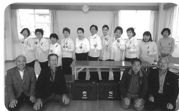
～ハンドベルを購入しました！～

赤い羽根共同募金は毎年4月から7月にかけて助成申請の募集があり、静岡県共同募金会で審査のうえ助成されます。