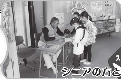
シニアの方と 交流!