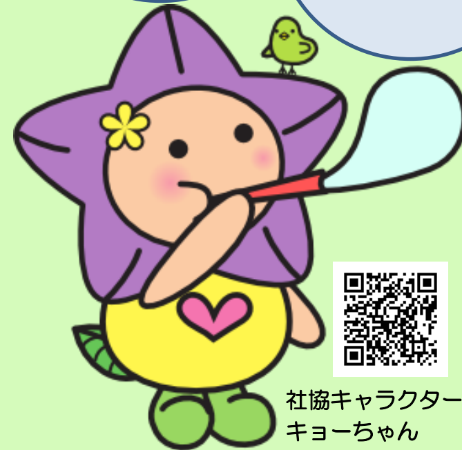
社協キャラクター キョーちゃん