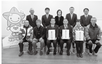
▲明るい社会づくり運動静岡県 掛川地区協議会のみなさま