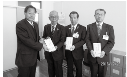
▲連合静岡東遠地域協議会のみなさま