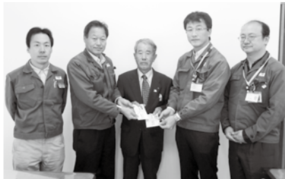
▲矢崎部品株大東工場全矢崎労働組合大東支部 大浜工場全矢崎労働組合大浜支部のみなさま