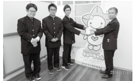
▲掛川工業高等学校吹奏楽部の みなさま