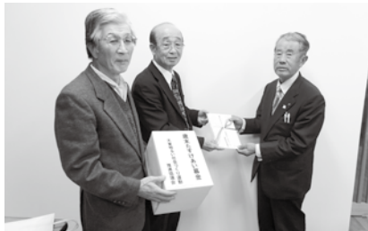
▲大東明るい社会づくり運動 推進協議会のみなさま