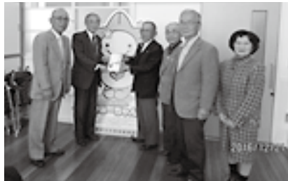
▲シニアクラブ掛川支部のみなさま