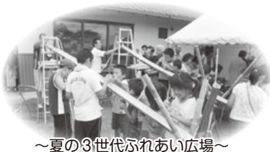
～夏の3世代ふれあい広場～