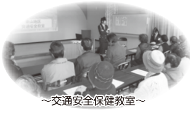
～交通安全保健教室～