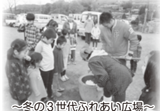
～冬の3世代ふれあい広場～

東山地区では年間大きな行事として、夏の三世代ふれあい広場、冬の三世代ふれあい広場、交通安全・保健教室があります。多くの人の参加があり、にぎやかな催しになっております。