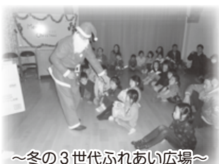
～冬の3世代ふれあい広場～