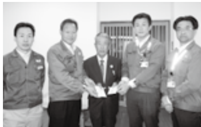
▲矢崎部品(株)大東工場全矢崎労働組合大東支部 大浜工場全矢崎労働組合大浜支部のみなさま