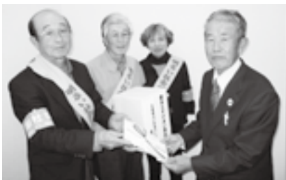
▲大東明るい社会づくり運動 推進協議会のみなさま