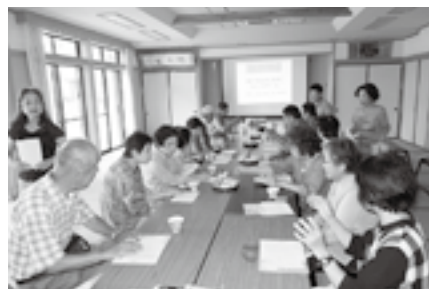
～「気楽に寄ってさろん」の様子～

今年度から大須賀第二地区「福祉ふれあいまつり」と銘打ち、地域の人たちが気楽に参加して、楽しみながら「福祉活動」と身近にふれあうイベントを開催します。地域の色々な福祉活動紹介や、福祉お助け用品展示紹介、児童・お年寄りも楽しめるゲーム等を行います。高齢化、生活障がい者化が避けて通れない時代だからこそ、「私の町には、楽しく安心な見守りのネットワークがあるよ」といえるまちづくりを目指します。