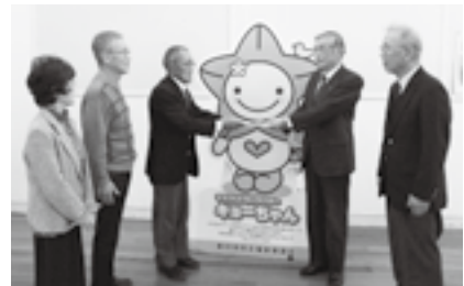
▲シニアクラブ掛川支部のみなさま