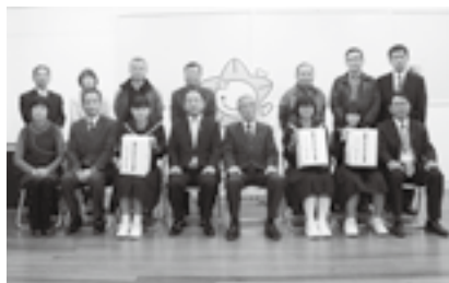
▲明るい社会づくり運動静岡県 掛川地区協議会のみなさま