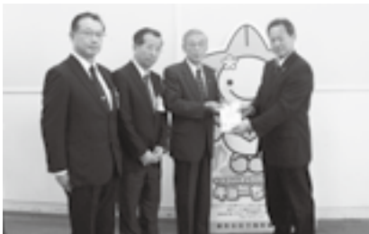
▲連合静岡東遠地域協議会のみなさま