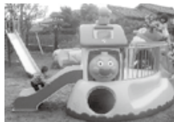
大浜愛育園大型遊具 (H25助成)

助成を希望される団体は、申請書の提出が必要です。助成要綱及び申請書は掛川市共同募金委員会（掛川市社会福祉協議会・各ふくしあ社協）にあります。また、県共同募金会ホームページでも申請書や助成要綱がダウンロードできます。