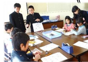
↑ 昨年度の様子です!