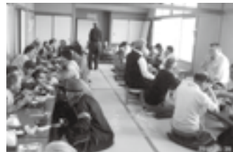
なんといっても楽しみなお弁当。

現在は各区で『福祉懇談会』を開催する準備をしています。慣れないことを進める苦労は大きいですが、区内の人たちが、困っている人のために助け合い、安心した暮らしができるよう一同張り切って活動しています。