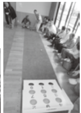
無心でパット。ビンゴになれば30点！