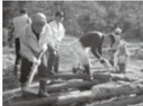
いきいき農園での作業