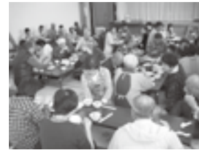
いも汁が振る舞われた交流会