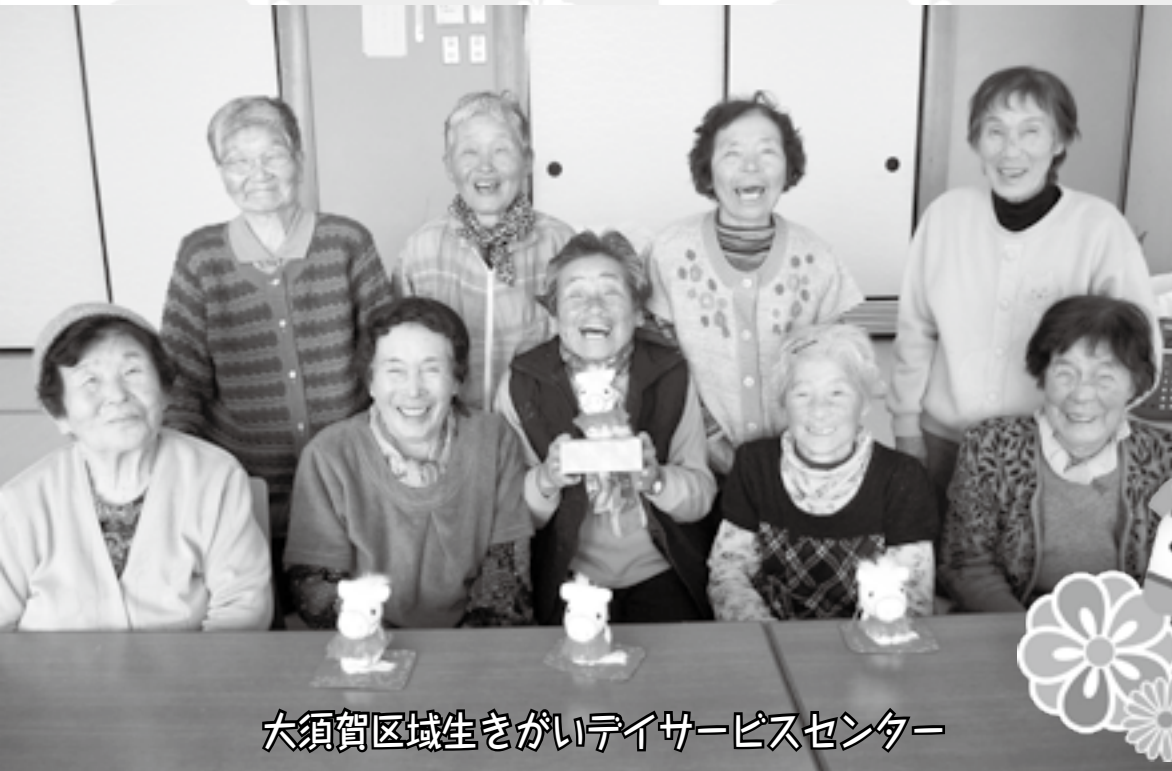
大須賀区域生きがいデイサービスセンター

掛川市西大淵100 市役所大須賀支所1階 TEL 48-5531 FAX 48-1013