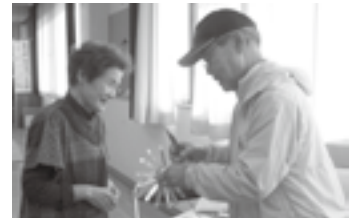
空き缶を使った風車作り