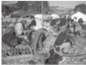
浮き球についた貝を取る作業