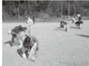
河川敷の清掃活動