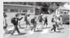
6年生をリーダーとした通学あいさつ運動