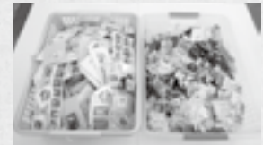
こつこつと集めた古切手・ベルマーク