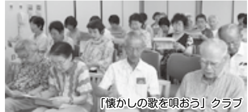
「懐かしの歌を唄おう」クラブ

短期講座終了後に、自主クラブとして活動しているグループがたくさんあります。社協は、続けて講座を受けたい高齢者やグループを支援します。