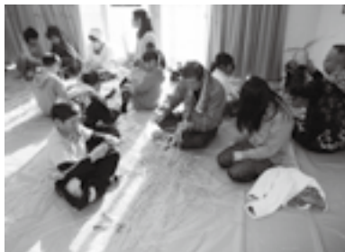
冬の三世代ふれあい広場

平成20年センター福祉部より地区福祉協議会に組織改正しました。地区役員、センター役員、民生委員、保健委員、センター婦人部で構成されております。活動内容は、子供から高齢者までを対象とした夏の三世代ふれあい広場、冬の三