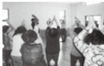
第四支部活動 介護予防活動