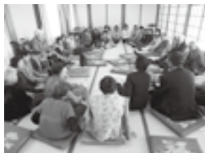
第三支部活動 健康講座