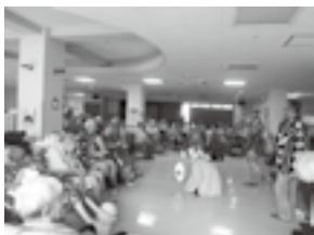
第二支部活動 訪問活動