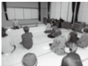
第一支部活動 健康講座

大須賀第二地区福祉協議会は、平成23年3月に発足し2年が経過しています。地区内を4支部に分け、各支部共に「やれる活動を進めよう」をモットーにスタートし、現在も地道に活動しています。今後は、地域福祉活動の中で地域住民と交流しながら、互いに協力して第二地区の福祉の向上を図っていきたいと思っています。