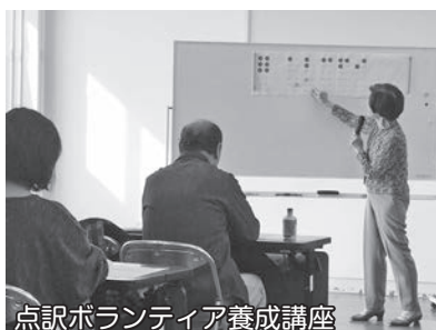
点訳ボランティア養成講座