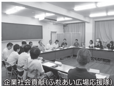
企業社会貢献(ふれあい広場応援隊)