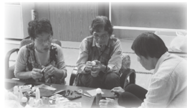
東大坂区 ひまわりの会 工作