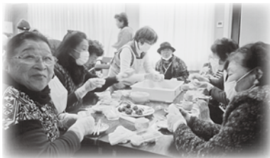
大坂区 気楽会 餅つき大会