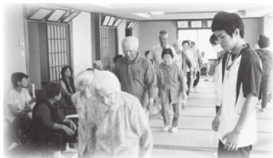
三井区 三寿会 健康講座

今後は多くの人にサロンへ参加してもらうために、地域のサロン運営の継続、サロンの会場に来るのが困難な高齢者の足の問題について検討し、更に充実していきたいです。