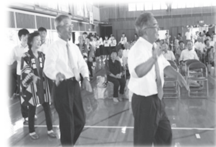
♪敬老会での佐東音頭♪

新しい取り組みとして、生活支援車両運行委員会を立ち上げ、本年度中の運行を目指しています。