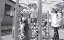
● 子育てを応援する活動に 「保育園に園庭遊具を整備」 (静岡市・十七夜山しづかわほいくえん)