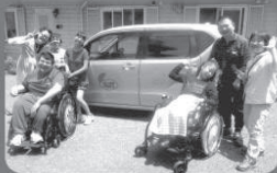
● 障害者を応援する活動に 「日中活動・送迎用軽自動車を整備」 (富士市・障害者デイスサービス エーる)