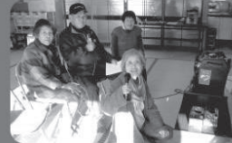
● 引きこもりや孤立を防ぐために 「高齢者サロンにワイヤレスアンプを整備」 (森町・上川原憩いの場「みのり」)